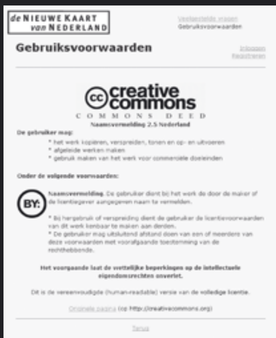
fig. 2 Gebruiksvoorwaarden Nieuwe Kaart van Nederland (lekenversie), www.nieuwekaart.nl

licentieovereenkomst) en een computerleesbare versie die ook voor digital rights management (DRM) kan worden gebruikt. De lekenversie beslaat enkele regels in eenvoudig Nederlands met de relevante symbolen. De juridische versie beslaat enkele pagina's in juridische taal, dit is de daadwerkelijke overeenkomst die bindend is. De computerleesbare versie bestaat uit een XML-code met een